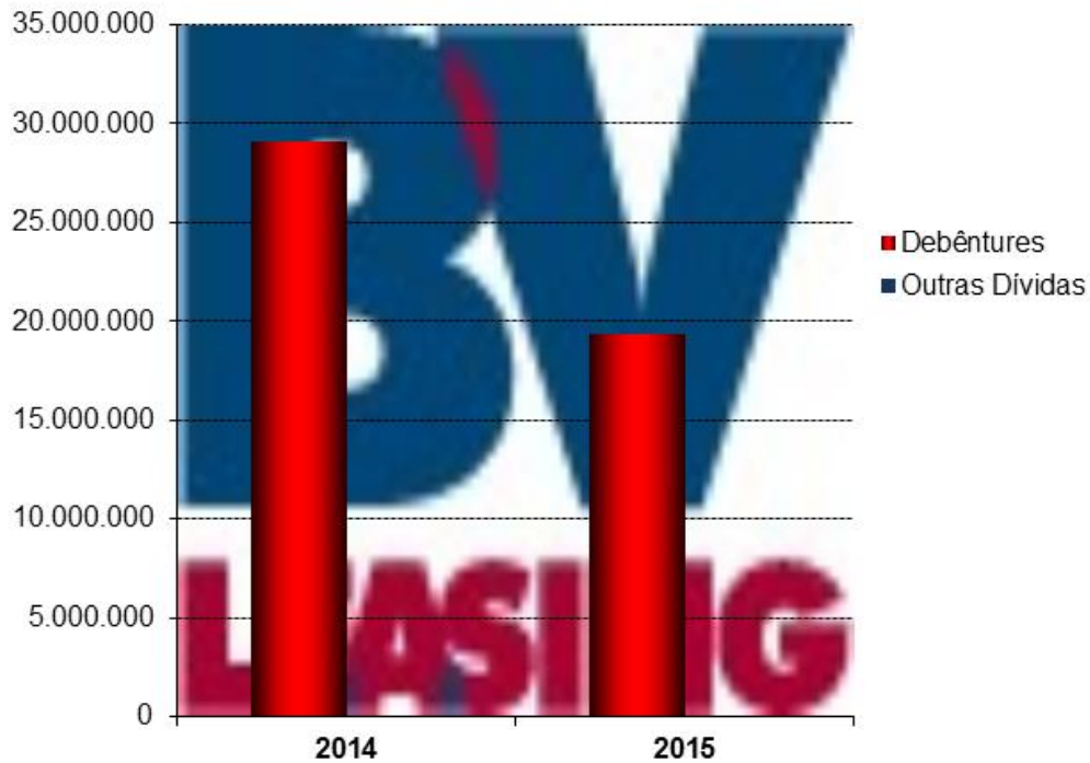
Gráfico: Dívida X PL (Valores em R$ mil)